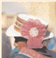
Campesina del Valle del Colca

E-mail: convento-la-recoleta@terra.com.pe