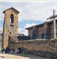
◀ Iglesia de Jalca

Ubicado a una altura de 2700 msnm, este complejo arqueológico de los chachapoyas data de los años 1100 a 1300 d.C. Se calcula que tiene una extensión de 4 hectáreas y presenta las clásicas construcciones circulares decoradas con frisos en alto relieve en forma de rombos y de zigzag.