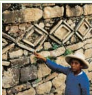
◀ Niño en fortaleza de Kuélap